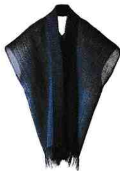
Kuroshio - Courant chaud, 2018 MAÏTÉ TANGUY